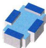
TABELLA DI RIPARTO SPESE D'ESERCIZIO 2023

Ripartizione a carico dei Comuni come da preventivo